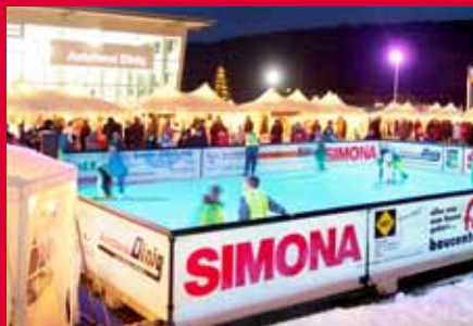
Каток из искусственного льда на рождественской ярмарке у автосалона Диниг, Хохштеттен-Даун, Германия