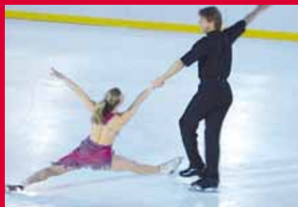
Каток из искусственного льда в Чехии