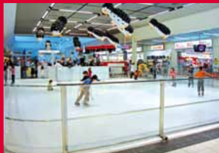
Каток из искусственного льда в «littoral centre» Аламан, Швейцария