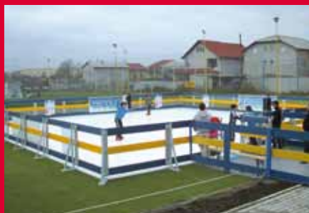
Каток из искусственного льда в Румынии для активного отдыха